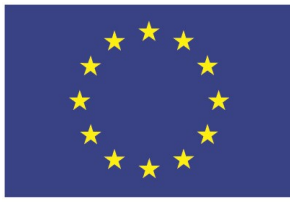
Unione europea Fondo sociale europeo